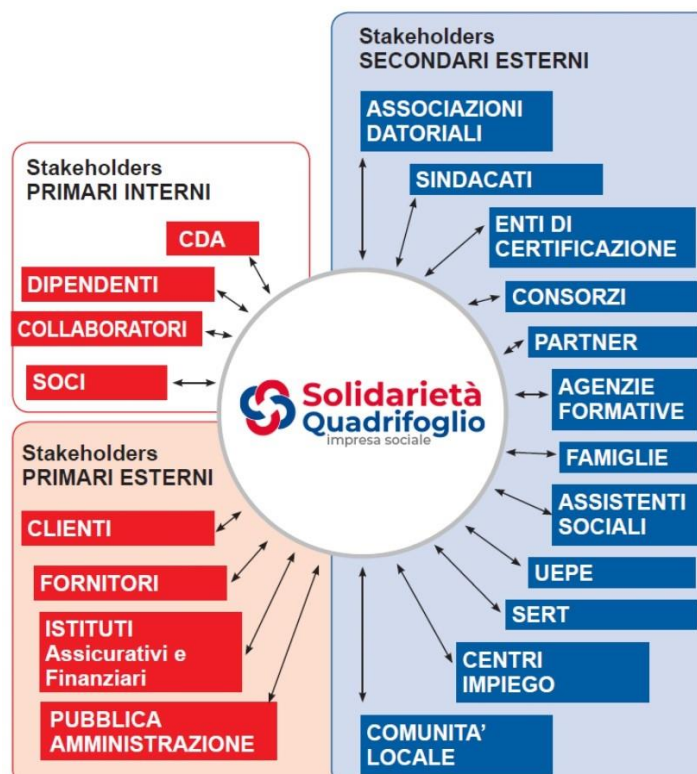
Immagine mappa degli Stakeholder